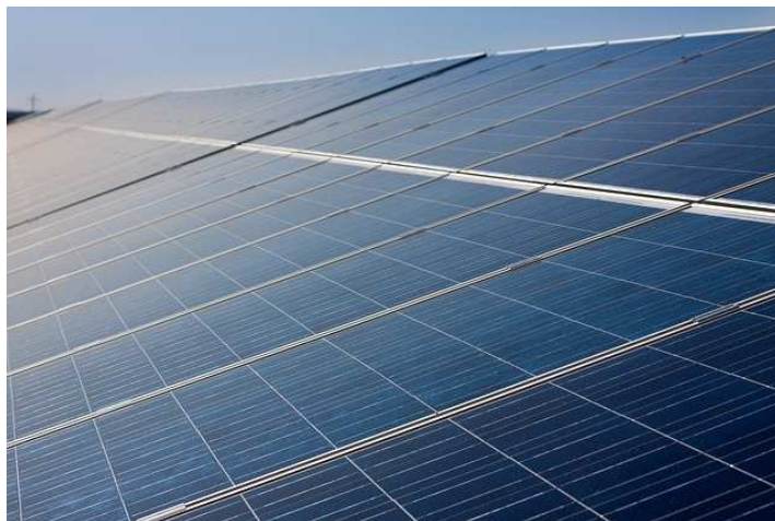
Panel solar fotovoltaico policristalino

Los primeros paneles solares policristalinos de silicio aparecieron en el mercado en 1981. A diferencia de los paneles monocristalinos, en su fabricación no se emplea el método Czochralski. El silicio en bruto se funde y se vierte en un molde cuadrado. A continuación se enfría y se corta en láminas perfectamente cuadradas.