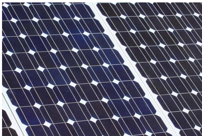
Panel solar fotovoltaico monocristalino

Las celdas solares de silicio monocristalino (mono-Si), son bastante fáciles de reconocer por su coloración y aspecto uniforme, que indica una alta pureza en silicio, tal como se muestra en la imagen: