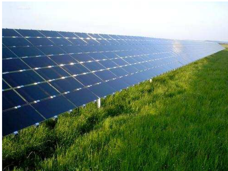
Panel solar fotovoltaico de capa fina

Dependiendo del tipo, un módulo de capa fina presentan una eficiencia del 7-13%. Debido a que tienen un gran potencial para uso doméstico, son cada vez más demandados.